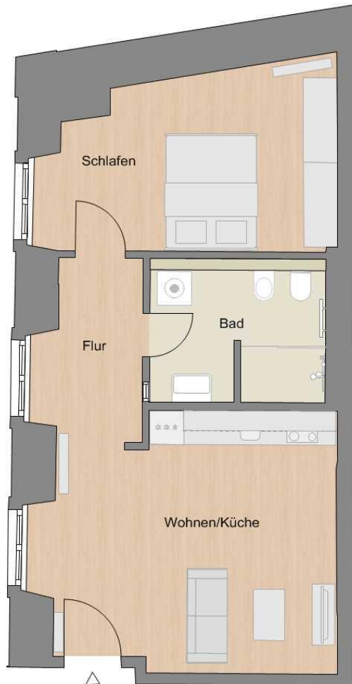
Apt. 31 (N13)